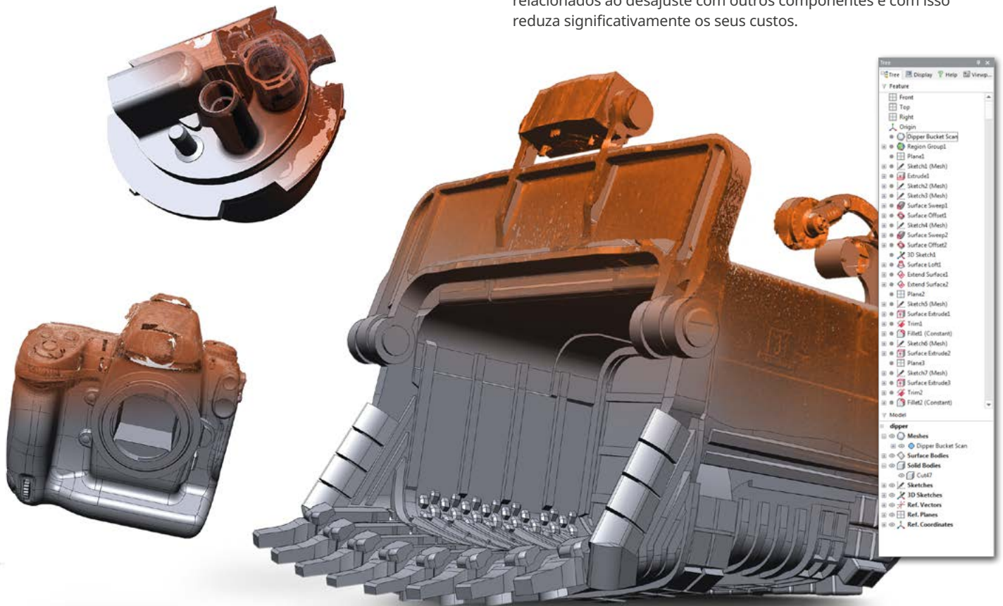
Modelos sólidos paramétricos criados no Geomagic Design X

Economize uma quantidade significativa de tempo e dinheiro ao modelar peças como construídas e como projetadas. Deforme um modelo CAD existente para ajustar às suas digitalizações 3D. Reduza os custos de interação de ferramenta usando a geometria real da peça para corrigir o CAD e eliminar problemas da peça. Reduza erros relacionados ao desajuste com outros componentes e com isso reduza significativamente os seus custos.